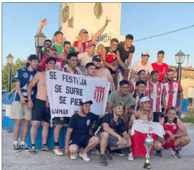
Arboledas dejó en el camino a Deportivo Pirovano por penales y va por el desafío de vencer a Agrario.

concluirá toda la actividad de este año del fútbol rural.