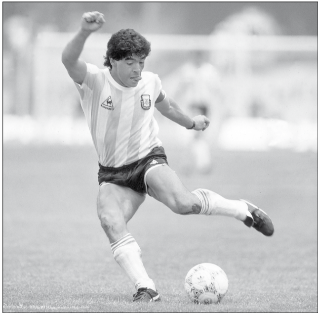
Diego Maradona cumpliría 64 años.