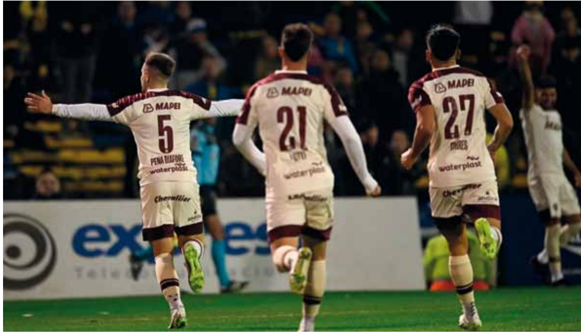
El equipo argentino busca llegar a la final en Asunción

El Granate igualó 1 a 1 en la ida y deberá ganar en la vuelta