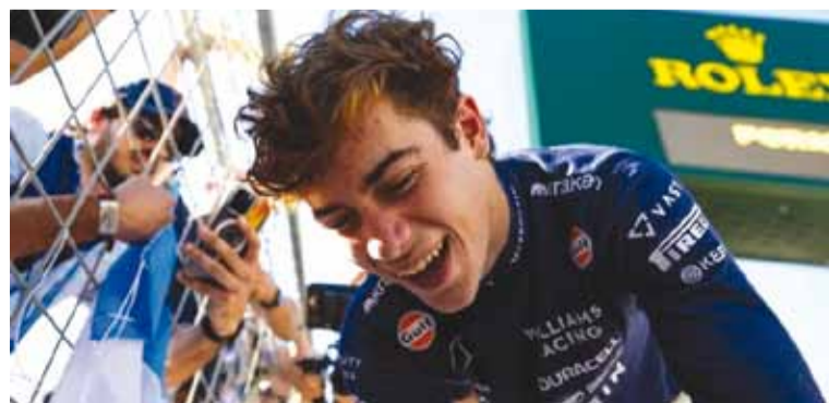
Colapinto, en la Fórmula 1