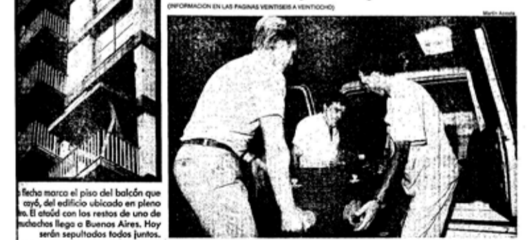
Otra tragedia. La tapa de Clarín del día siguiente de la tragedia de Pinamar

Lo denunció el intendente • Por eso cayó el balcón • El caso abre interrogantes sobre la seguridad de algunas construcciones