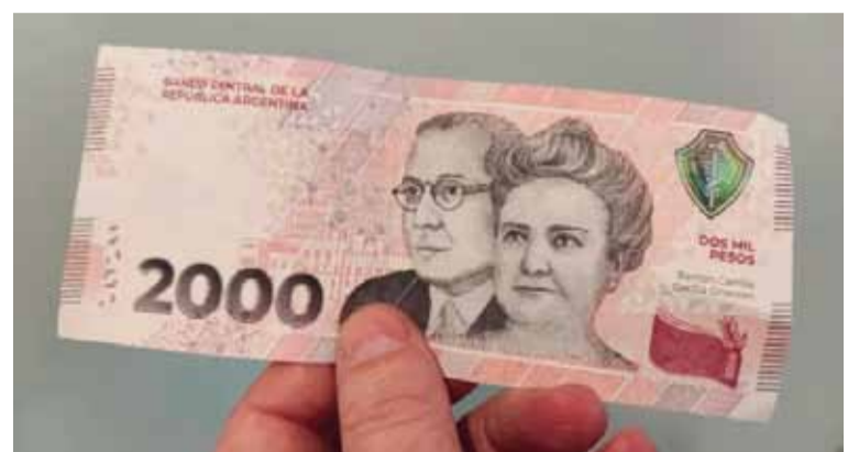
Se suspendió la emisión del billete de $2.000

La intervención de la entidad se llevará a cabo por un período de 180 días, bajo la dirección de