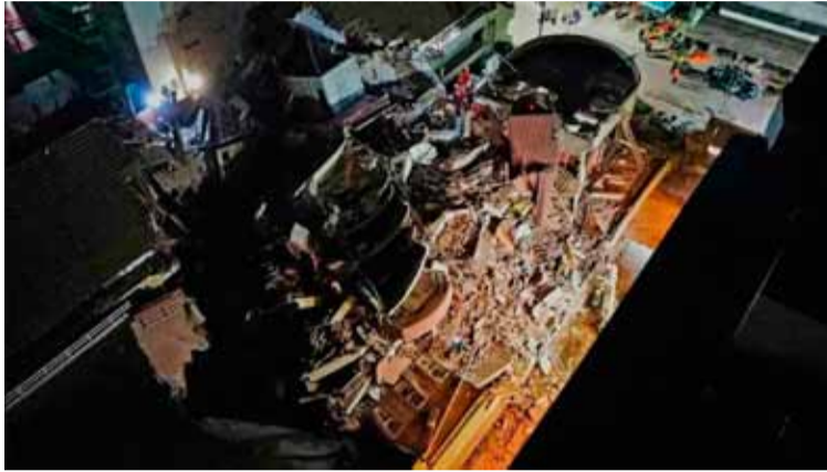
Primera imágenes. De la madrugada de ayer, tras el derrumbe del edificio

Según indicó un jefe de los bomberos locales, "se calcula que entre 7 y 9 personas se encontraban en el Hotel al momento del derrumbe, entre trabajadores de una obra que se estaba realizando con la incorporación