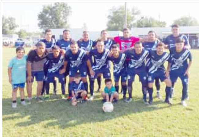
Agrario, sólido campeón del torneo, quiere tener también la Copa en sus vitrinas.

El próximo domingo, en la cancha de Vallimanca, se jugarán los dos partidos decisivos por la Copa Desafío, jornada con la cual