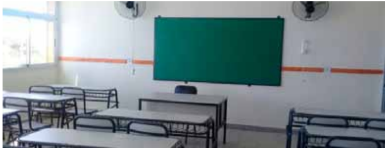
La mayoría de las escuelas y universidades no dictarán clases

al paro es la UTA, por lo que el Gobierno espera que el impacto sea mucho menor. Este gremio por ahora tiene votado un cese de actividades para el jueves, aunque “culpan” por la medida a empresarios y no a la administración nacional.