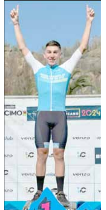
Bruno va cerrando un año en el que sumó kilómetros y experiencia.