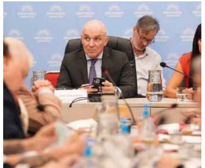
Espert y el oficialismo lograron el dictamen para la privatización de la línea de bandera

La Cámara de Diputados retomó el debate del proyecto sobre la privatización de Aerolíneas Argentinas, en medio de un fuerte conflicto con los gremios aeronáuticos que este miércoles