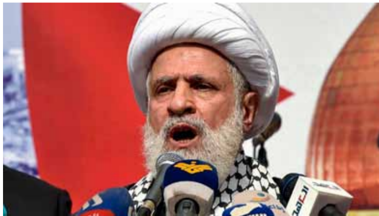
Naim Qassem. Nuevo líder de Hezbollah

Estudio bajo la guía de importantes eruditos chiitas en Líbano al mismo tiempo que obtuvo un grado de maestría y licenciatura en química en la Universidad Libanesa, además, durante varios años trabajó como profesor de