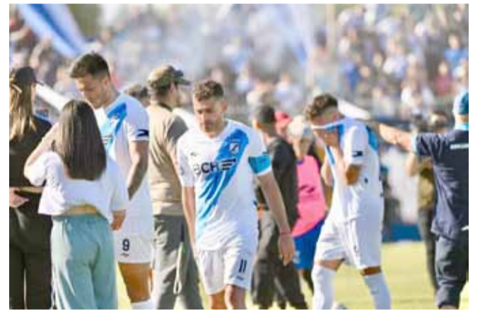
Momento difícil para Brown de Madryn. Después de 12 temporadas en la B, descendió al Federal A.

Los 56 puntos conseguidos en 38 partidos lo depositaron en el sexto puesto de la tabla de posiciones de la Zona A. Allí, el líder y clasificado a la final por el primer ascenso fue San Martín de Tucumán, con 81 unidades.