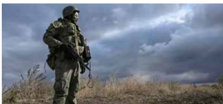
Picadora de carne. Rusia avanza a pesar del alto costo de vidas en sus filas

periódicas sobre las supuestas bajas ucranianas, pero dijo el lunes que Ucrania había sufrido más de 2.000 bajas en las líneas del frente en el noreste y este del país en los combates del día anterior. Newsweek se ha puesto en contacto con el ejército ucraniano para obtener comentarios por correo electrónico.